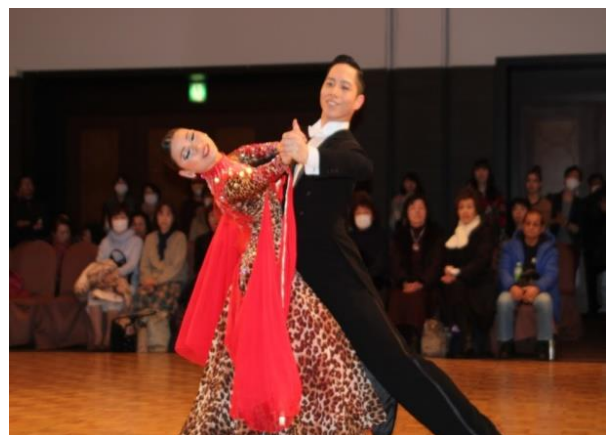
唯一、2月開催した「全道クラス別競技会」

当協会本部・札幌支部主催の毎月の定例交流会も9月までは中止となり、10月以降の社交ダンス交流会が開催できるかも危ぶまれているのが、現状です。