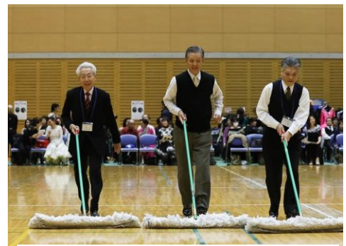
(大会役員も一生懸命、汗を流しました)