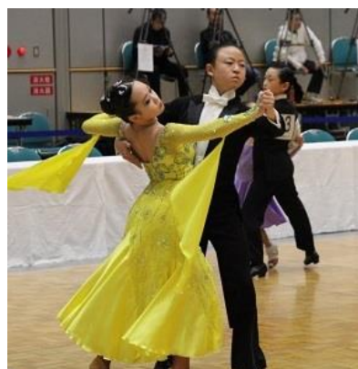
<ジュニア・スタンダード>

この大会で特で目立ったのは、プロフェッショナル・ラテンアメリカンの出場選手が10組を割り、8組となり、アマチュアも15組という、人材不足の感が歪めない寂しいものとなりました。