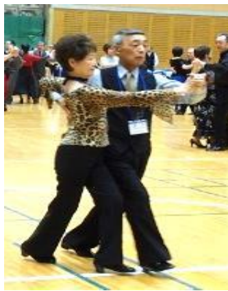
(大会役員も抜け出してひと踊り)