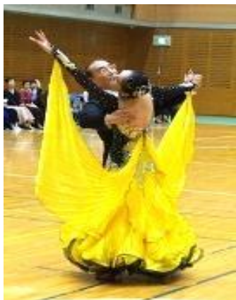
(アマデモの参加者)