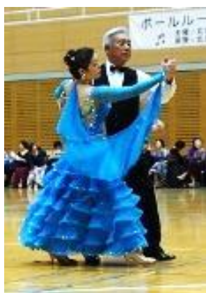
(ブラインドダンスの参加者)