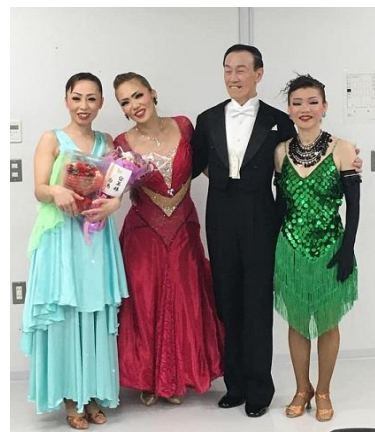
(アマプロデモ参加者の皆さん)